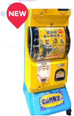
じゃばらいず 北山ガチャ