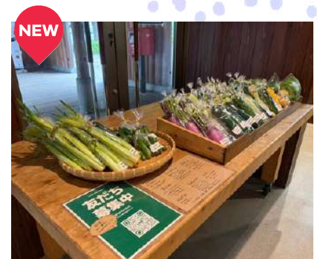
雨宿り 新鮮な野菜