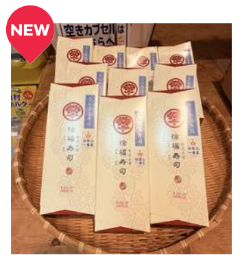
徐福寿司 さんま寿司

観光センター売店では、雨宿りさんの新鮮な野菜と徐福寿司さんのさんま寿司の販売を始めました。 毎週土・日曜日を中心に数量限定で入荷いたしますので、お越しの際はぜひご利用ください。 また、じゃばらいずのオリジナルグッズが当たるカプセルトイ（北山ガチャ）も新たに設置しました。ご来館の際はぜひお楽しみください。 ※野菜・さんま寿司は天候や仕入れ状況により、入荷がない場合があります。